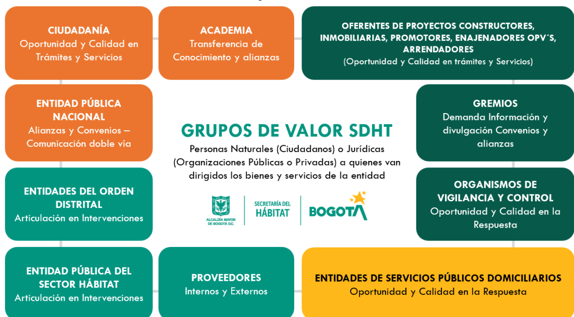
Ilustración 1. Grupos de valor de la SDHT